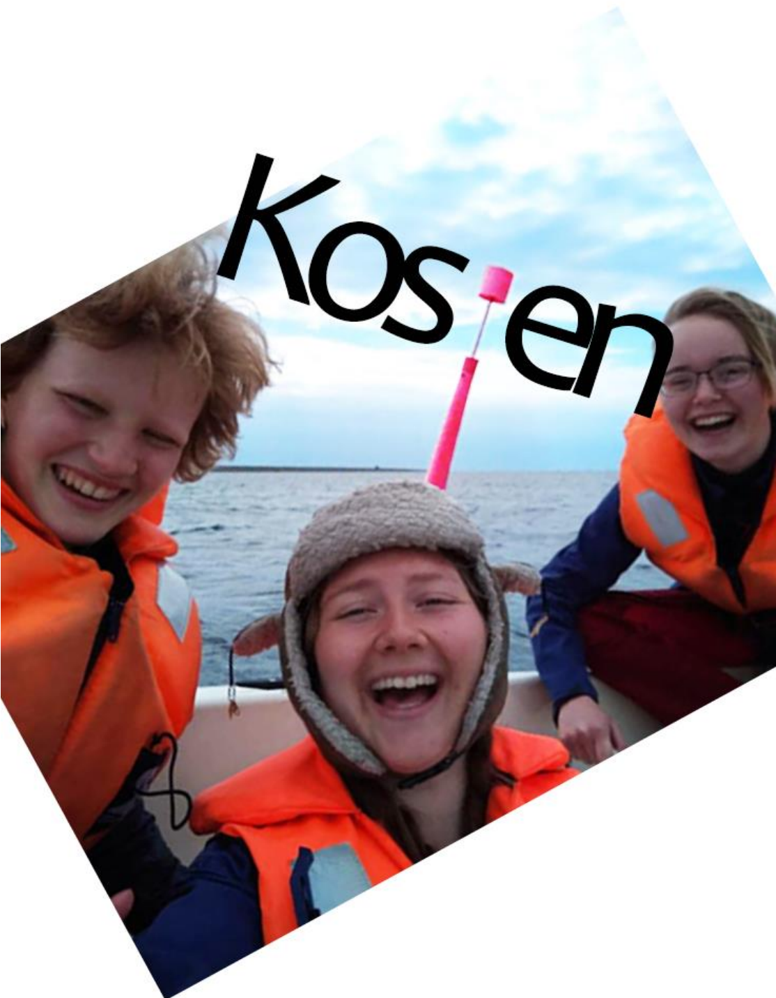
4. Hvidovres topkodyle medlemsblad