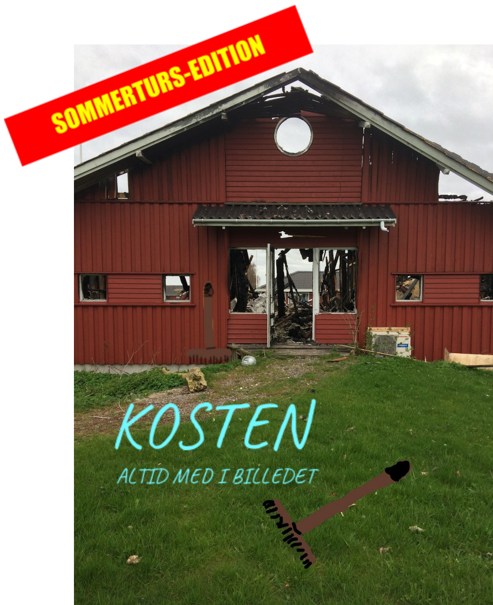
4. Hvidovres ultra-ninja medlemsblad:)<3

Velkommen til det nyeste Koste-koncept (Kostcept):