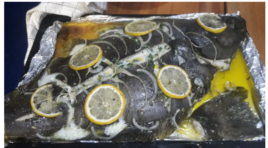
Her er vores Kelle <3